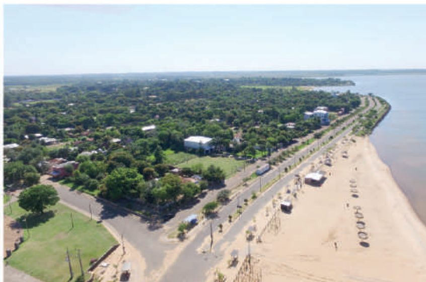
Se constituyeron nuevos espacios públicos con la recomposición urbanística.

La Entidad Binacional Yacyretá (EBY) entregó al municipio de Cambyretá un nuevo espacio de recreación y esparcimiento. Se trata de un quincho y una cancha para usufructo de la comunidad en el barrio San Francisco. La obra está ubicada en un estratégico lugar cerca de la costanera del distrito en el mencionado barrio.