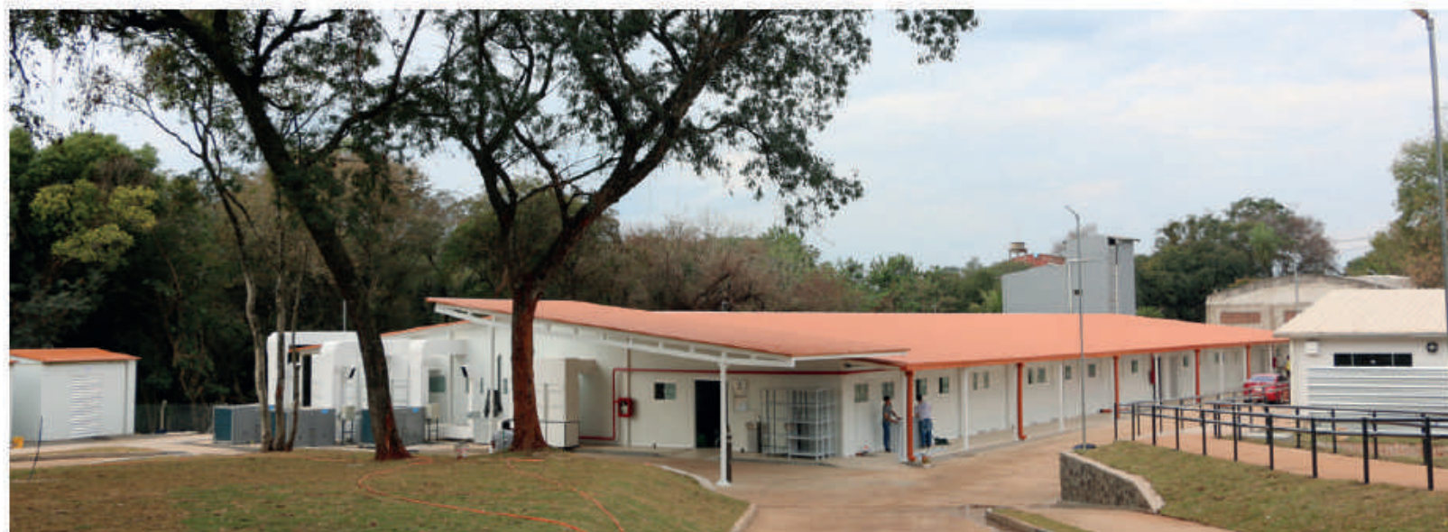
Pabellón de Contingencia en Encarnación.