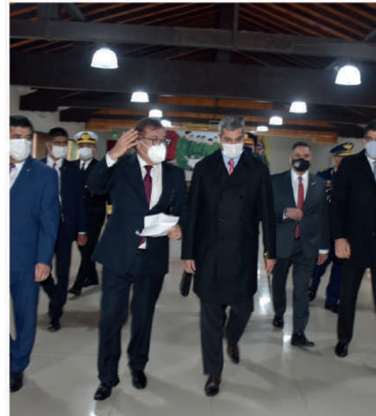
Presidente Mario Abdo Benítez y el director de la EBY Nicanor Duarte Frutos, en recorrido por las obras.

En total la binacional invirtió en el lugar la suma de G. 2.365.271.332. Se procedió a la refacción de dormitorios, auditorio, comedor y una biblioteca que guarda una importante cantidad de libros adquiridos también a través de la EBY. Otro sector fue mejorado con apoyo del gobierno de los Estados Unidos.