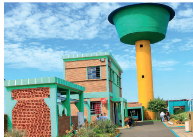
Planta de agua en San Pedro del Paraná.