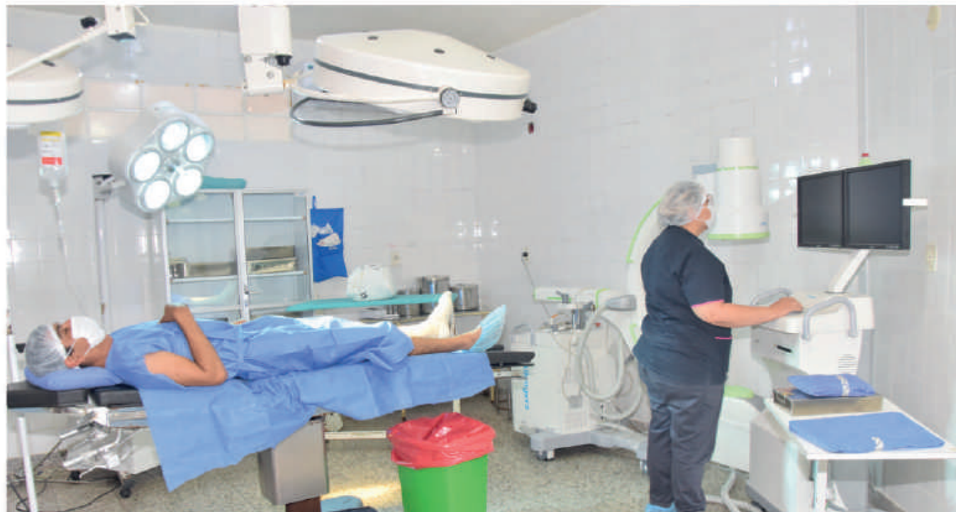
Arco en C, instalado en el hospital de San Juan Bautista.