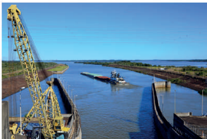
Operación de pasaje.

Su operación favorece a los productores de granos, armadores, a las terminales portuarias, abaratando los costos en el transporte de la producción nacional, cumpliendo con uno de los propósitos del Tratado de Yacyretá que es el mejoramiento de las condiciones de navegación en el río Paraná.