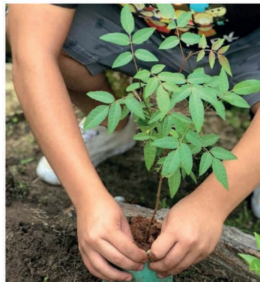
Colaborar con la recuperación del medio ambiente forma parte del compromiso social de los becados.

Lograr el "compromiso social" es una de las premisas.