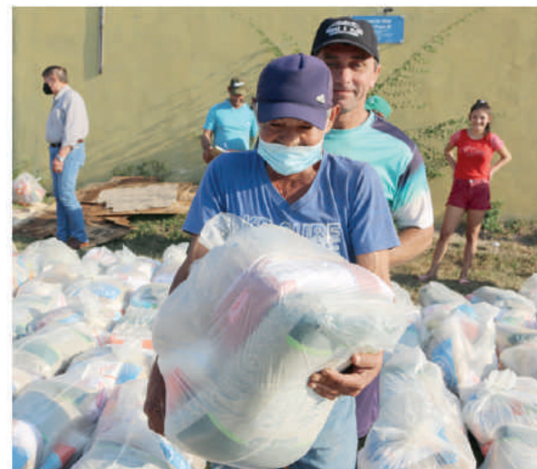
Los kits contenían alimentos de primera necesidad.