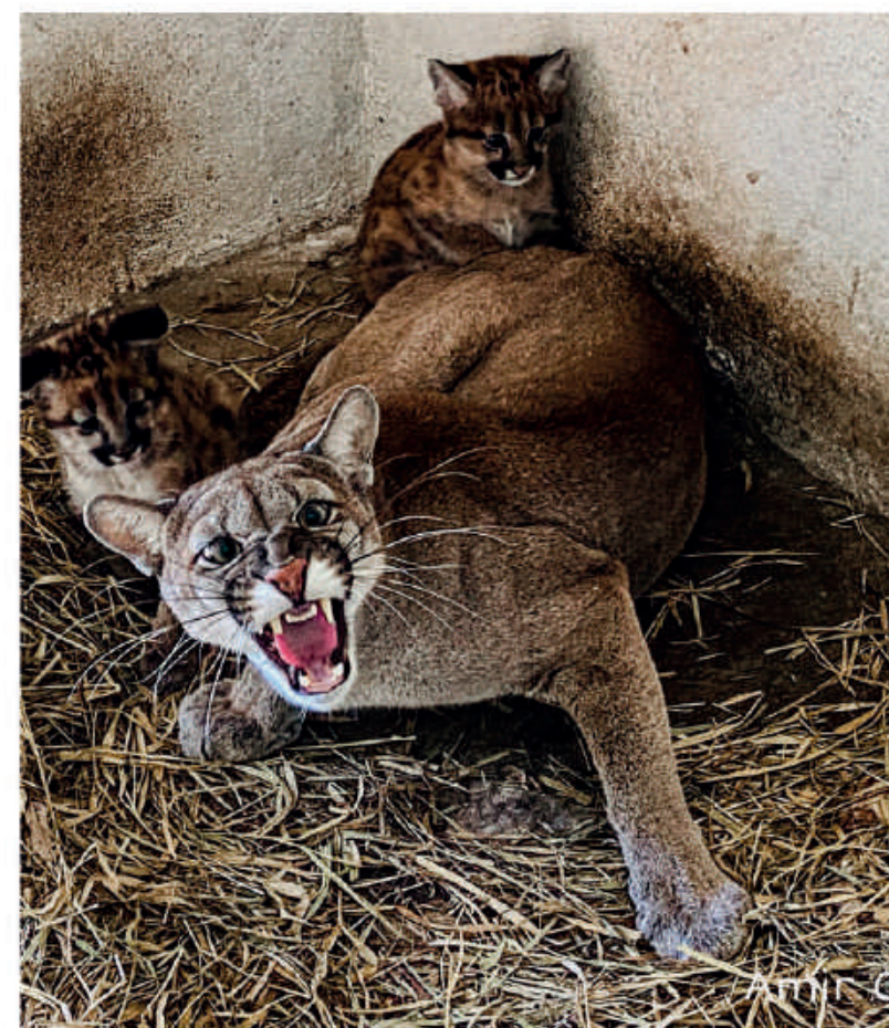
Puma Concolor con sus crías.

Yacyretá se destaca por la reproducción de animales en vías de extinción en este año 2021. El Refugio Faunístico Atinguy, mediante la implementación de su programa de reproducción de especies en cautiverio que se encuentran en estado vulnerable o que presenten problemas de conservación, lograron exitosos resultados. En este orden se destacan el nacimiento y la viabilidad de las crías de tres especies de animales de la fauna autóctona, como el Yagareté ( Panthera onca ), el Yagua Pyta (Puma Concolor) y el Aguará Guasú ( Chrysocyon brachyurus ). Esta última, es una de las especies que mayores dificultades presenta para la viabilidad de la cría en cautiverio, atendiendo las características peculiares del animal, constituyéndose en uno de los logros poco logrados en toda Sudamérica.