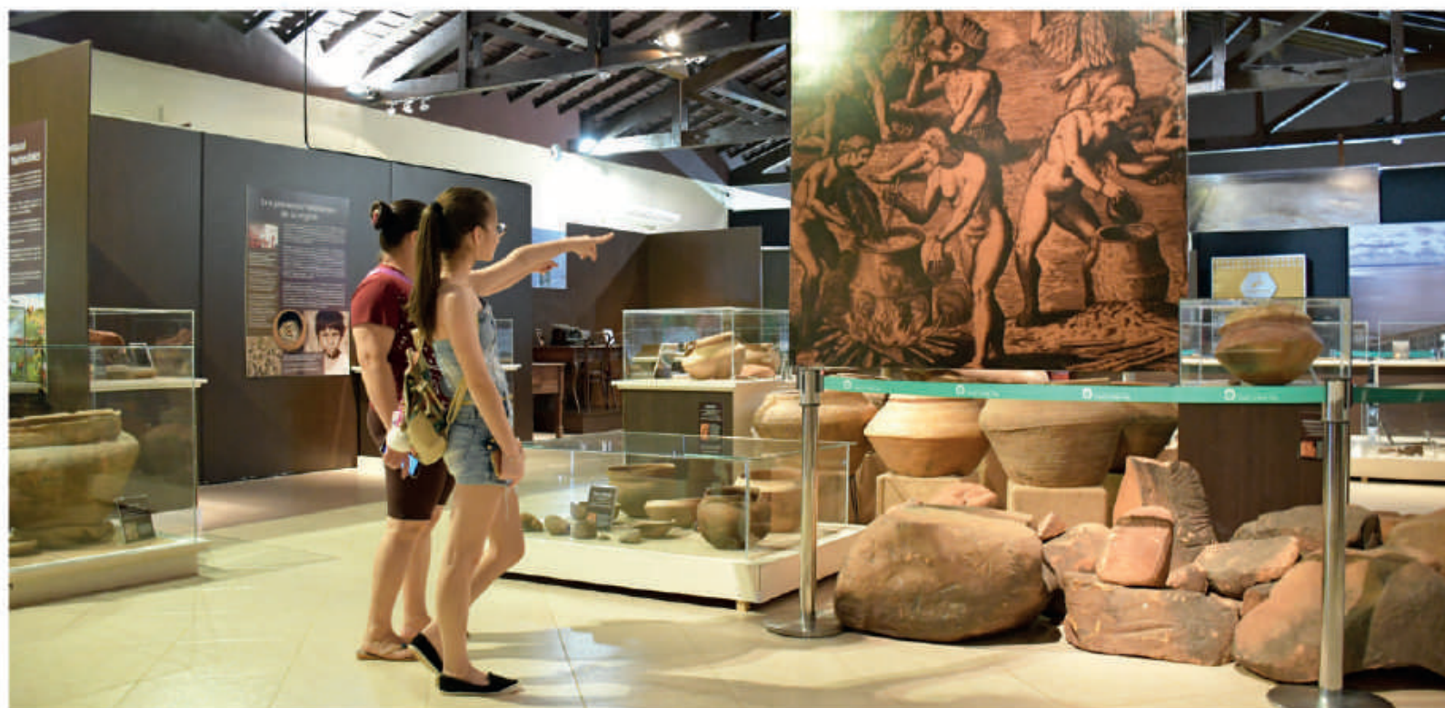
Museo en la Ciudad de Ayolas.

El mismo fue inaugurado en el año 1984, poco tiempo después de que la Entidad Binacional Yacyretá dispusiera el inicio de las obras civiles de la Represa. Se concibió en sus inicios como una tarea de rescate del patrimonio cultural en el área comprometida con la Hidroeléctrica.