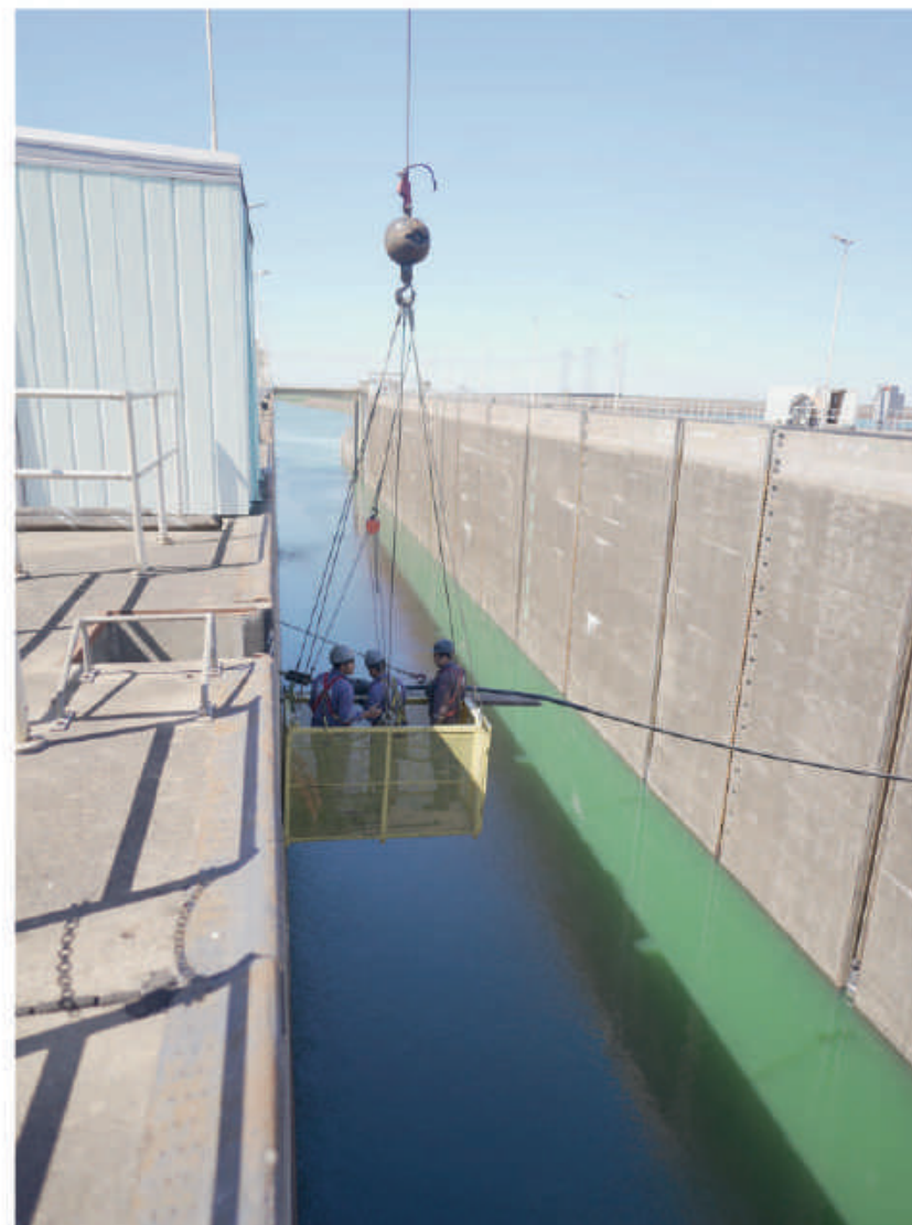
Esclusa de navegación.