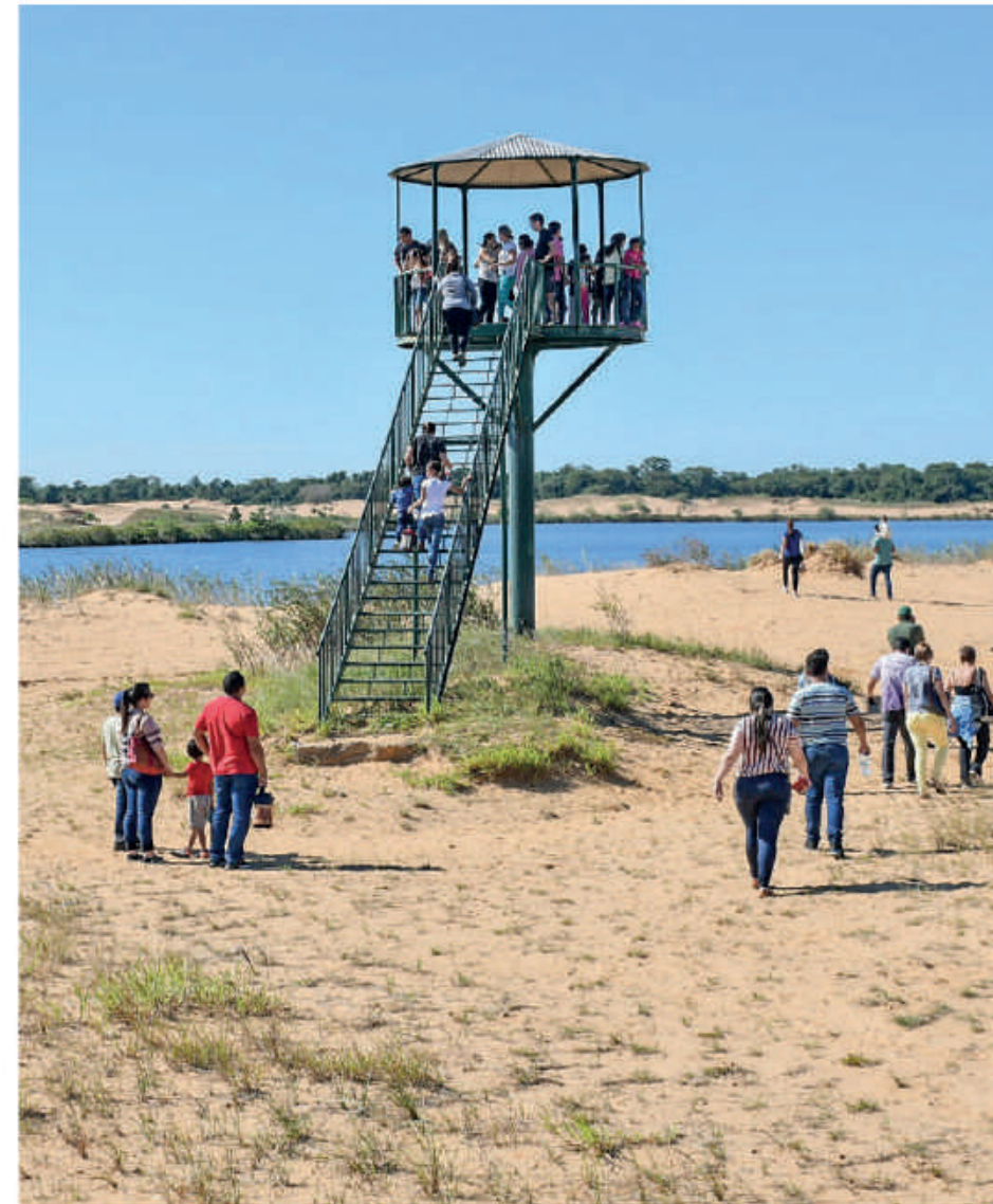
Mirador en zona de dunas.