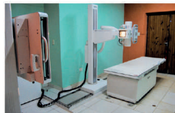
Modernos equipos entregados al nosocomio de Cnel. Bogado.