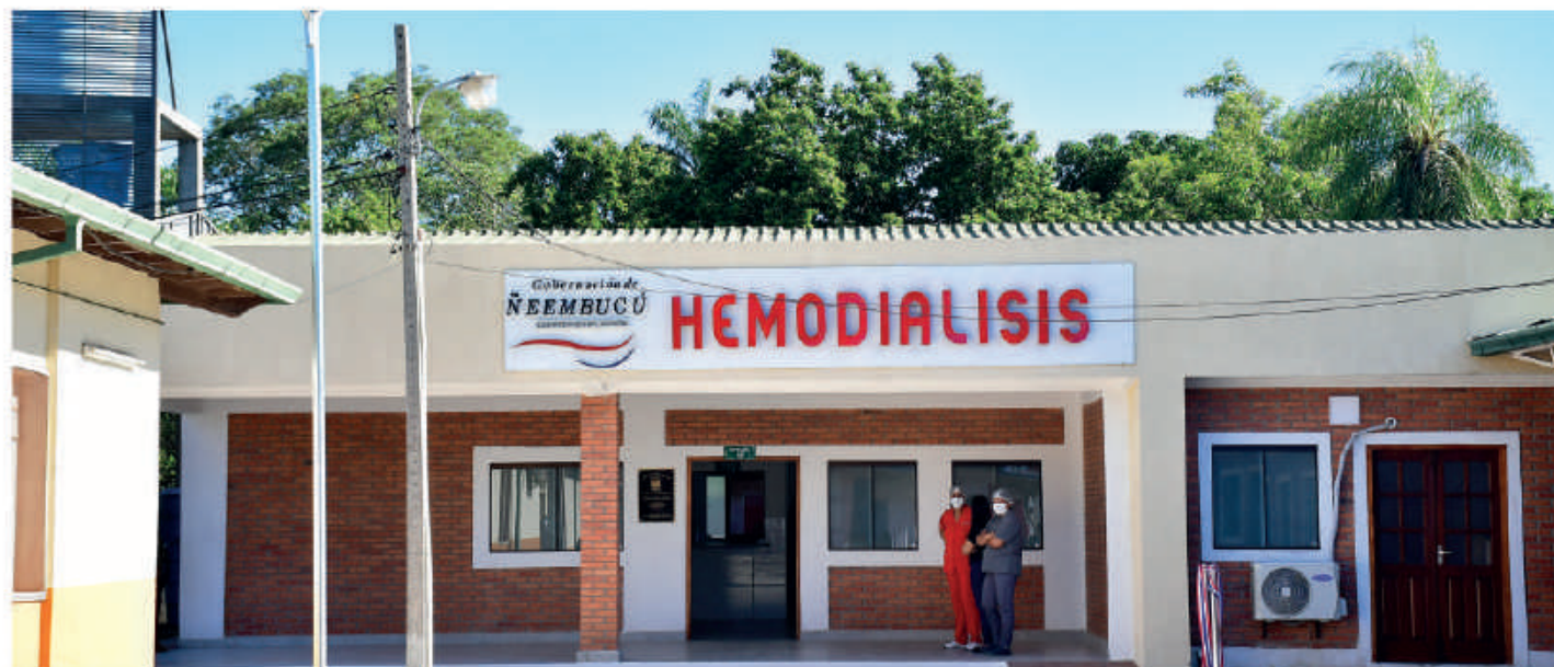
Pabellón de Hemodiálisis, en el Hospital Regional de Pilar.

La instalación permite la ampliación del servicio en el área de la Unidad de Terapia Intensiva para Adultos, con una inversión por parte de la EBY, de G. 1.713.535.890, consistente en adquisición de equipo de rayo X, tipo Arco en "C", montaje del sistema de aire filtrado, cámara de seguridad para la UTI y el centro de hemodiálisis; provisión de equipos médicos para diálisis, y equipamiento del sistema de planta de agua para el Centro Nefrológico.