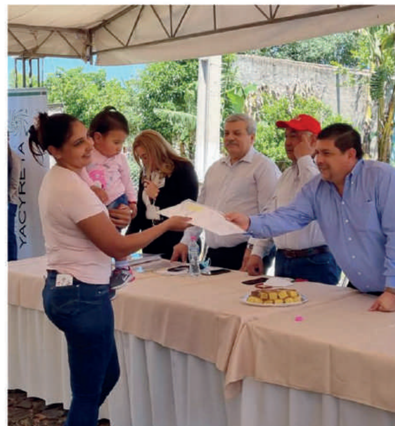
Centenares de familias accedieron a su título de propiedad mediante tarea llevada adelante por Asesoría Jurídica.

La EBY evitó pagar G. 453.643.796.102 durante la actual administración mediante sentencias favorables.