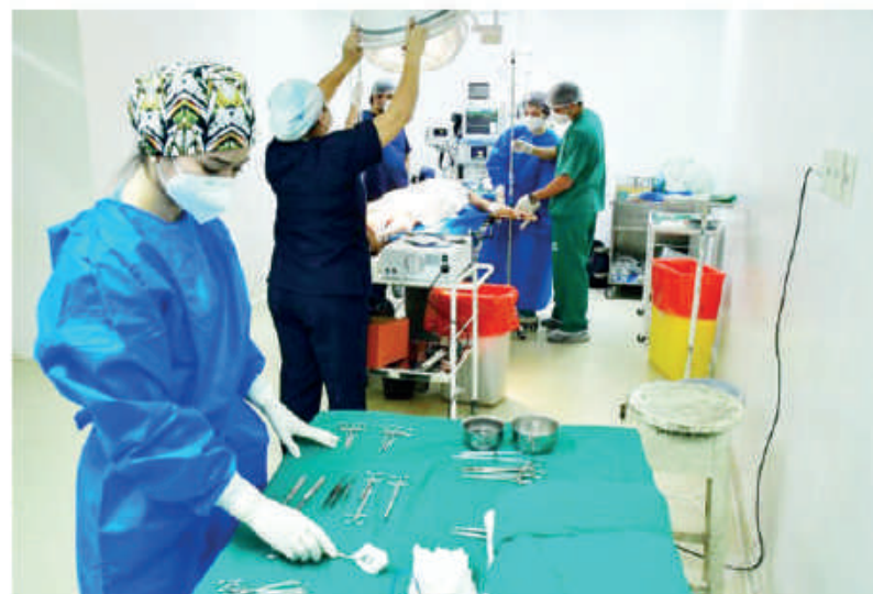
Beneficiarios del programa "Ñemyatyró Paraguay".