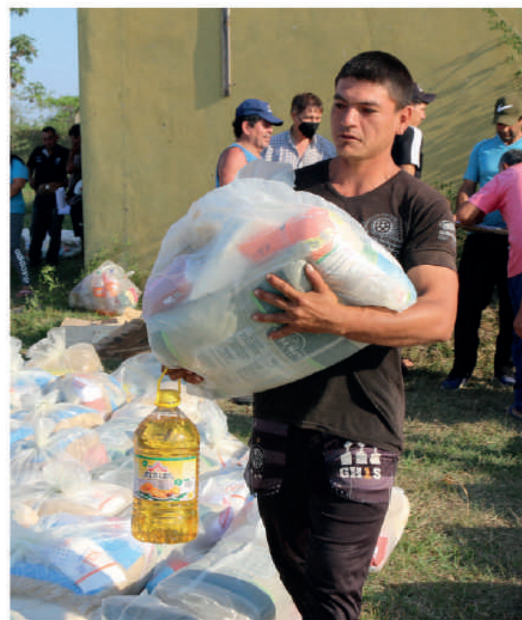
Beneficiarios retiran kits de víveres.

83.117 kits de víveres ENTREGADOS para garantizar la seguridad alimentaria de miles de compatriotas.