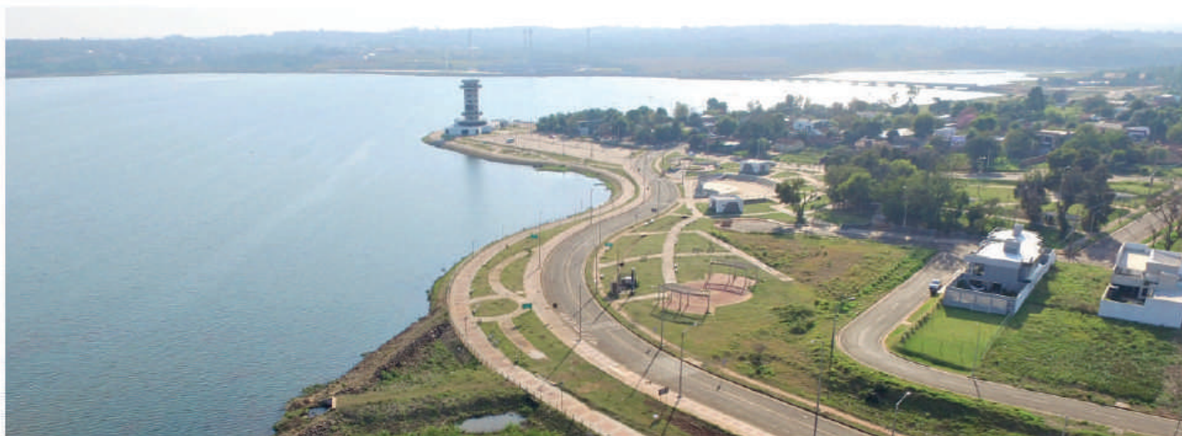
La avenida Costanera. En el fondo, el edificio del Mirador.

El anfiteatro al aire libre está proyectado para ser un lugar ideal para eventos sociales y está compuesto de un sistema de gradas de hormigón con capacidad para 400 personas. Cuenta con escenario techado y una explanada entre escenario y gradería. Todas las obras están dotadas de sistemas de iluminación, desagües pluviales y sanitarios. Se construyó también una plaza que antes era una canchita, se restauró completamente todo, colocando pergolados, asientos, iluminación, para un sector de recreación de los vecinos, y está ubicado al costado del anfiteatro.