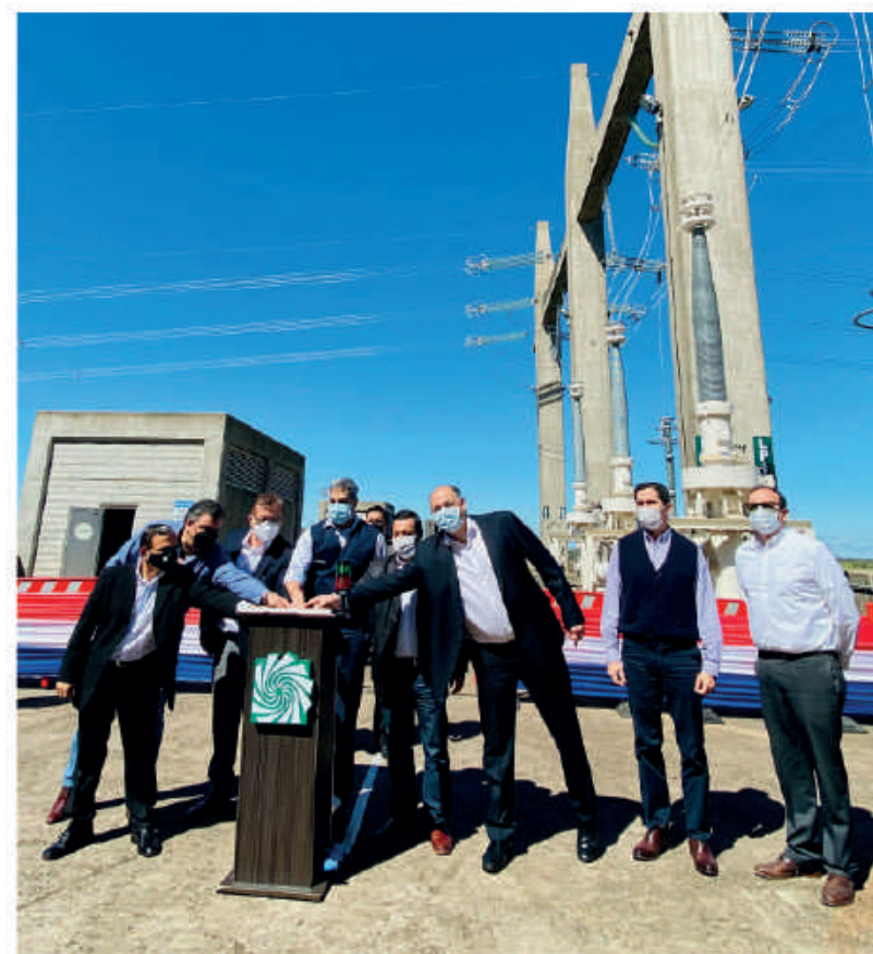
Línea Paraguaya 1, puesta en funcionamiento comercial.

La culminación de la infraestructura necesaria de Yacyretá para el sistema eléctrico paraguayo, en cumplimiento del plan energético del Gobierno Nacional, significa la libre disponibilidad de energía que le corresponde al Paraguay, mayor confiabilidad, menor pérdida en el transporte y menores cortes de energía, además de fundar las bases para la creación de la red energética regional de gran importancia.