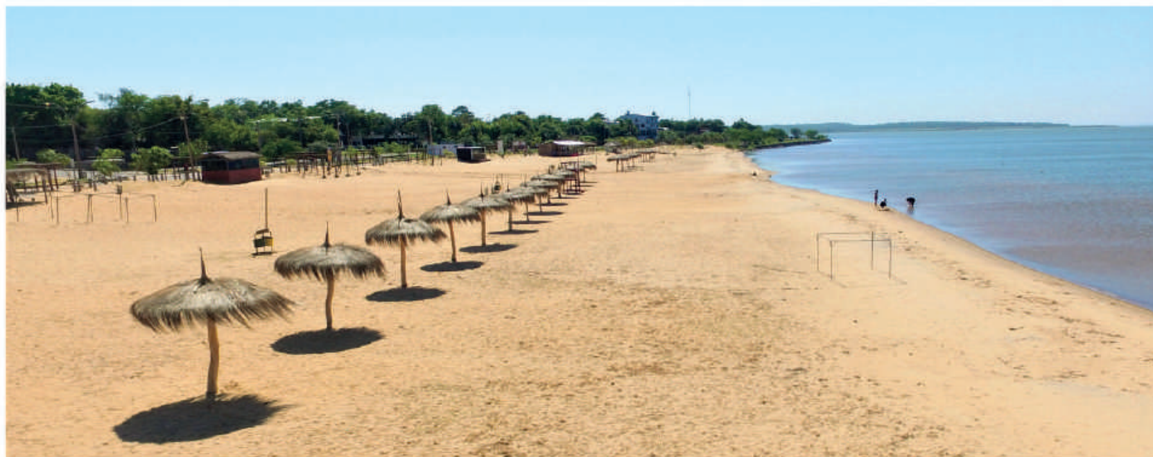
Playa de Carmen del Paraná, construida a través de la EBY.