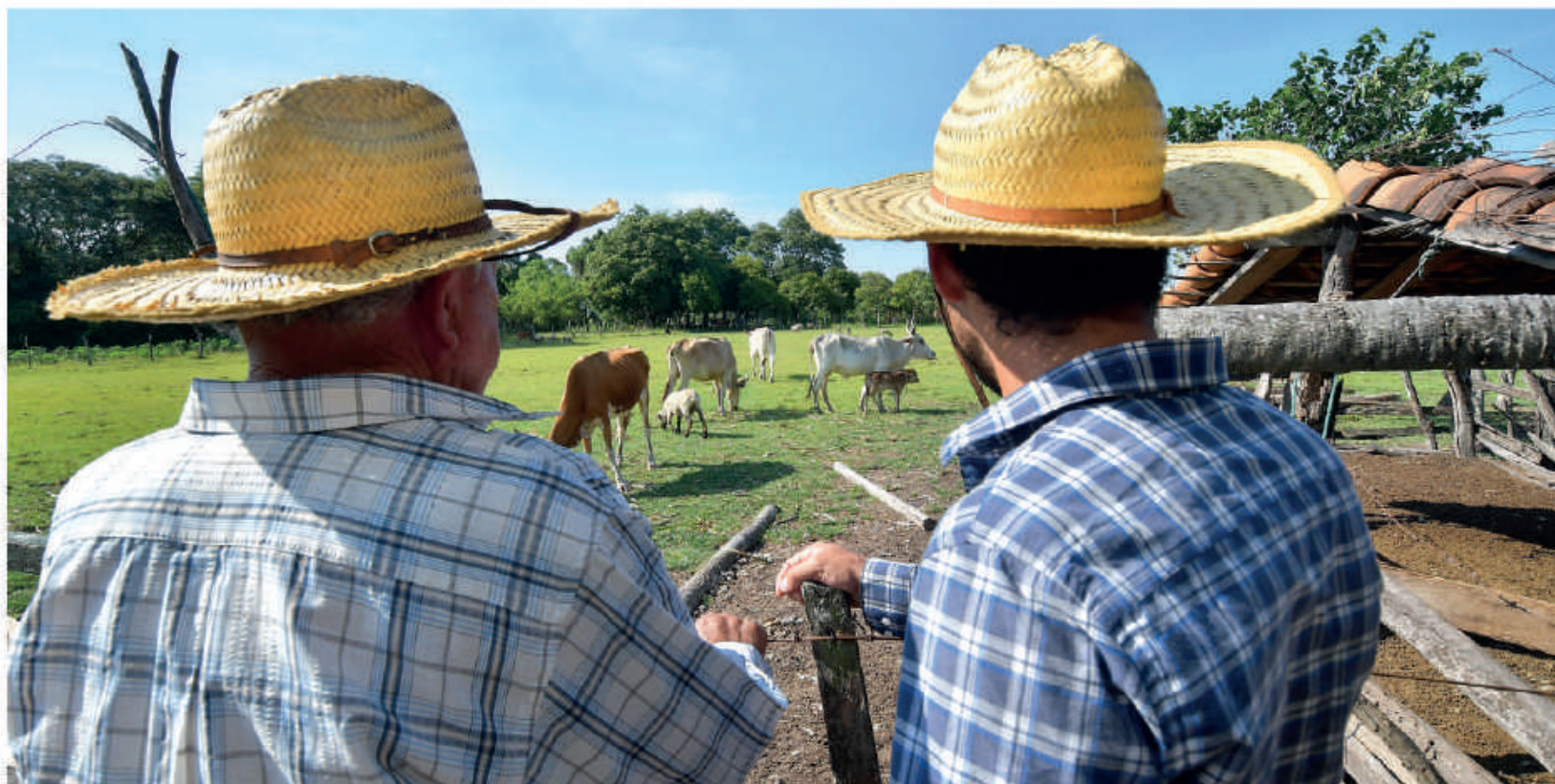
Pequeños ganaderos de diversos puntos del país también reciben apoyo para mejorar producción de ganado, producir leche y queso.

G. 26.304.171.182 MILLONES se invertieron en producción mediante convenio con gobernaciones.