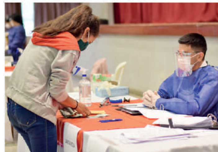
Estudiantes reciben lo correspondiente a pago por becas 2021.

Más de 4.000 ESTUDIANTES de 4 departamentos beneficiados con becas universitarias.