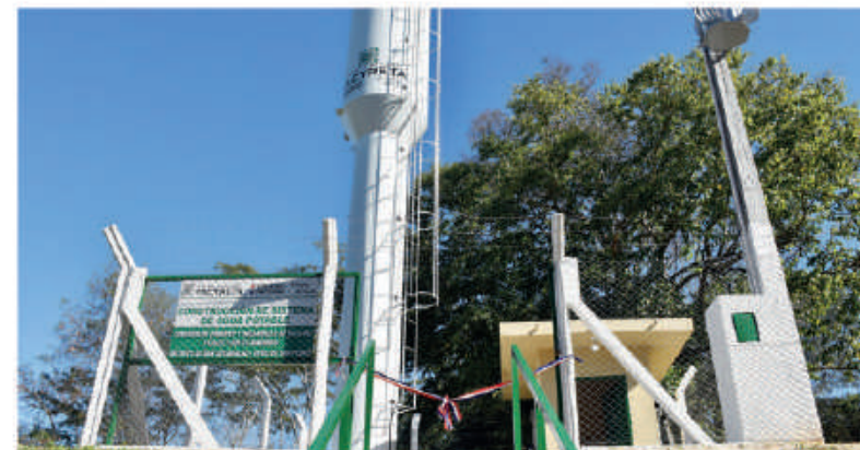
Servicio habilitado en distrito de San Estanislao.

Además, se han habilitado sistemas de agua potable en tres comunidades del distrito de San Estanislao (Departamento de San Pedro).