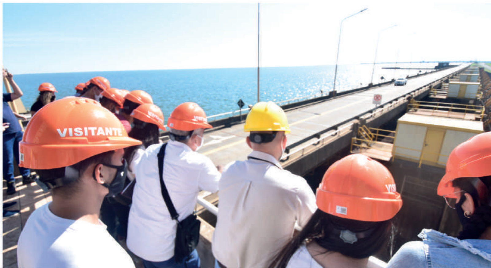
Visita guiada por la Central Hidroeléctrica.

Los atractivos turísticos de la Entidad Binacional constituyen un destino elegido por miles de compatriotas y extranjeros que visitan la zona. Antes de la Pandemia del Covid-19, un promedio de 40 mil personas por año eligió los tours de Yacyretá.