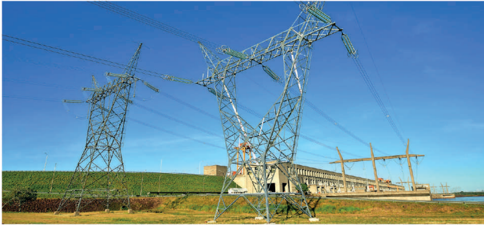
Sistema de distribución de energía.