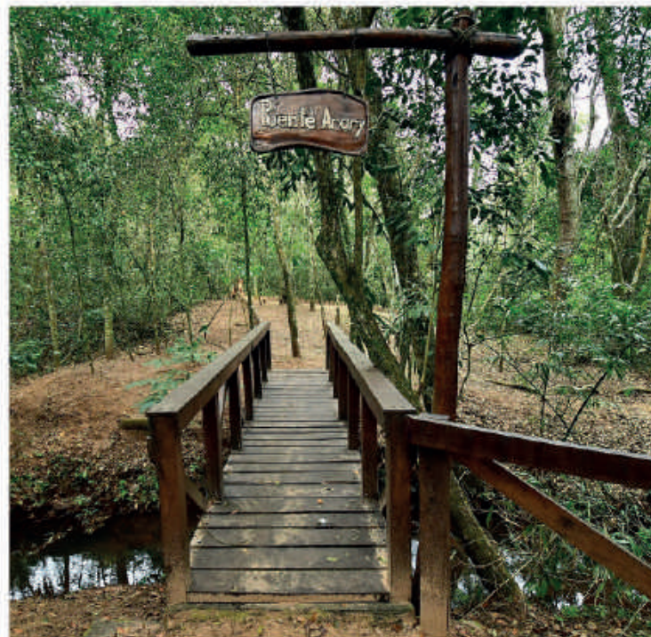
Reserva forestal, puente Arary.

Continúa con la visita guiada en el Museo Histórico y Ambiental, dependiente del Sector Medio Ambiente. Al término de la visita al museo, los turistas abordan los vehículos con acompañamiento de guías para realizar visitas con opciones diferentes conforme al interés. Esto incluye el recorrido en la monumental obra de la Central Hidroeléctrica Yacyretá.