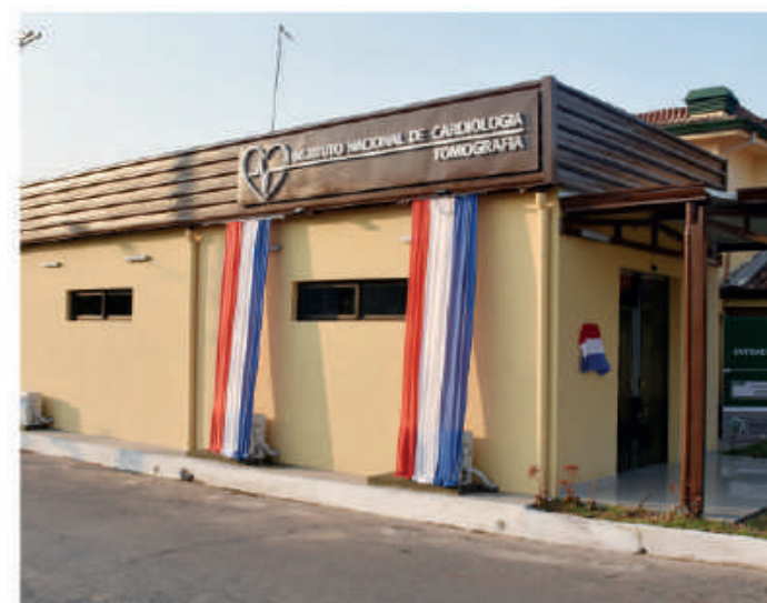
Instituto de Cardiología mejora atención con apoyo de la EBY.