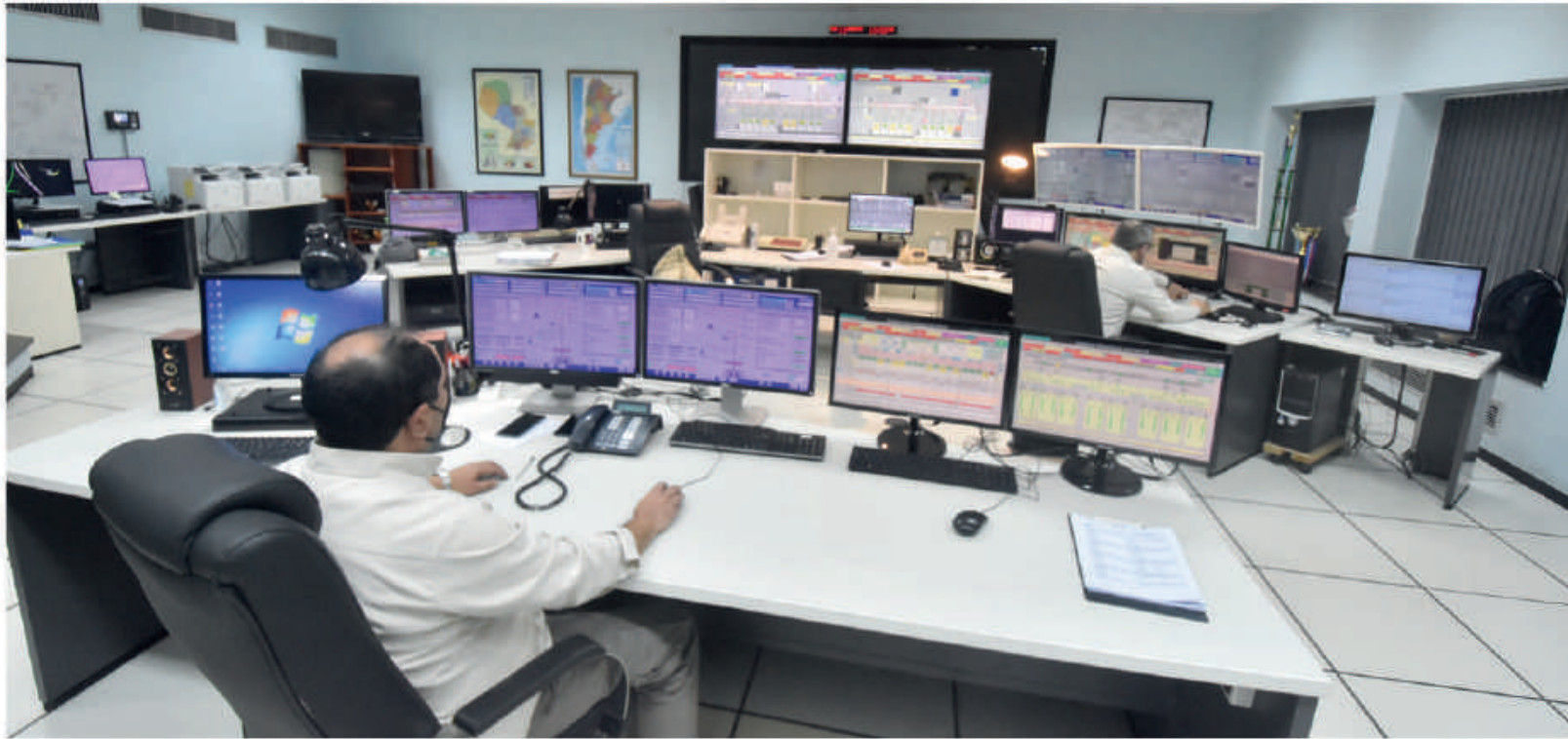
Sala técnica de la hidroeléctrica Yacyretá.