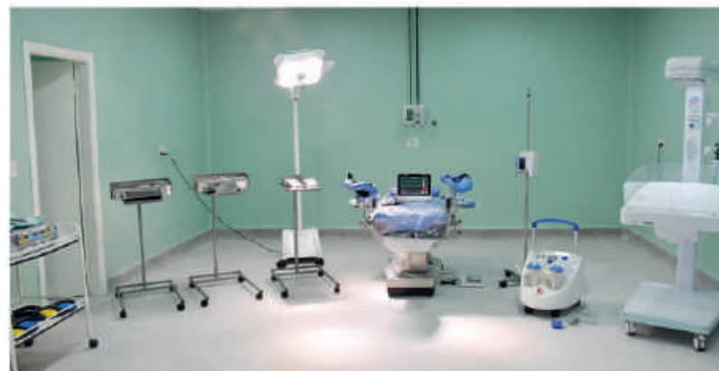
Equipos entregados al Hospital de Santa María.

En todos los casos, se orienta no solamente de superar heridas físicas, sino también de recuperar la esperanza en lograr una mejor inserción social y optimizar la calidad de vida.