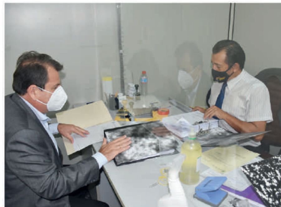
La Entidad entregó a la Contraloría todos los documentos requeridos para auditar la gestión, inclusive de administraciones anteriores.