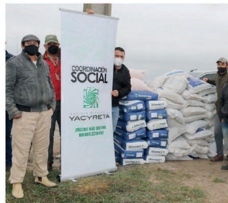
Productores de Caazapá reciben apoyo para desarrollar diversos proyectos.