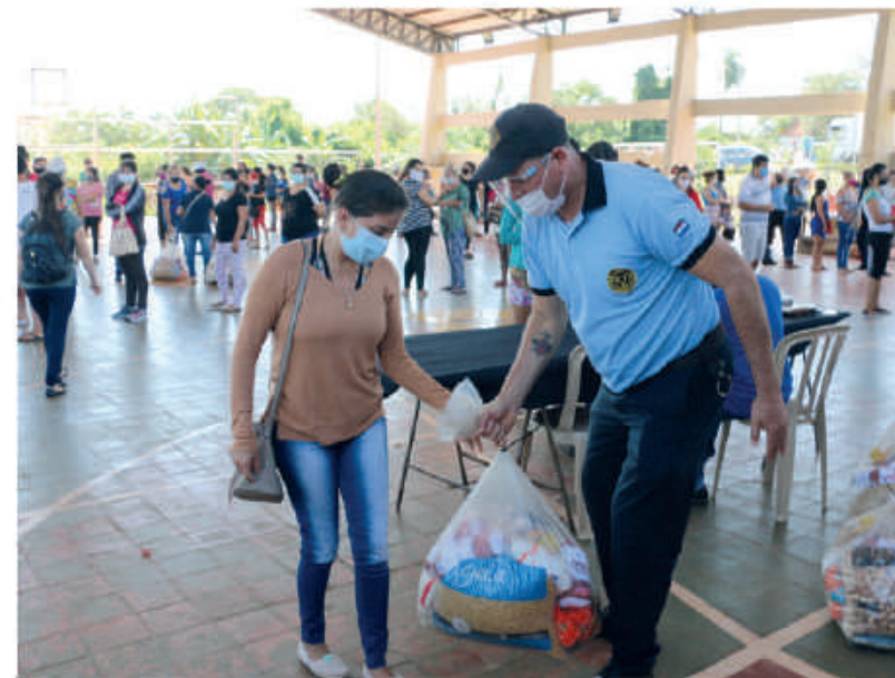
Kits de víveres en Itapúa, llegaron a unas 25.300 familias.