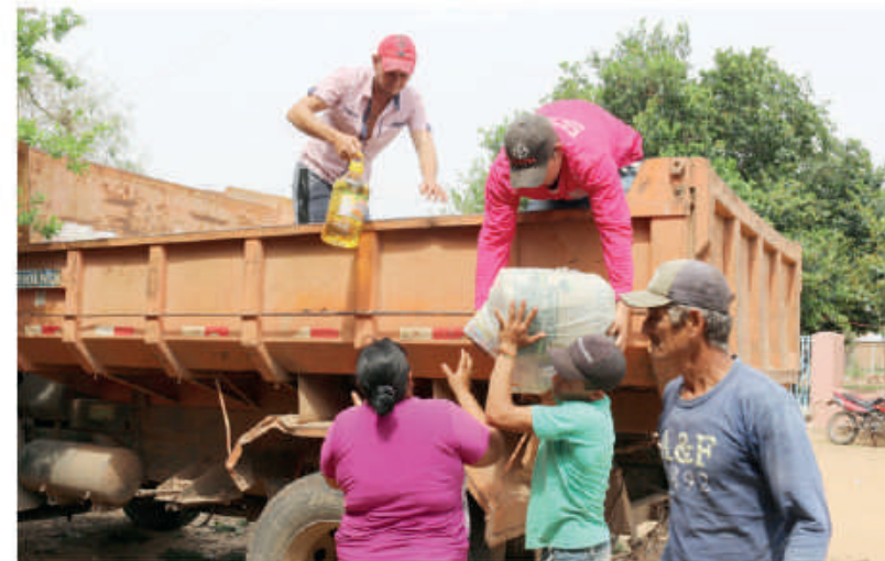
El beneficio también alcanzó a pobladores de Misiones y Caazapá.