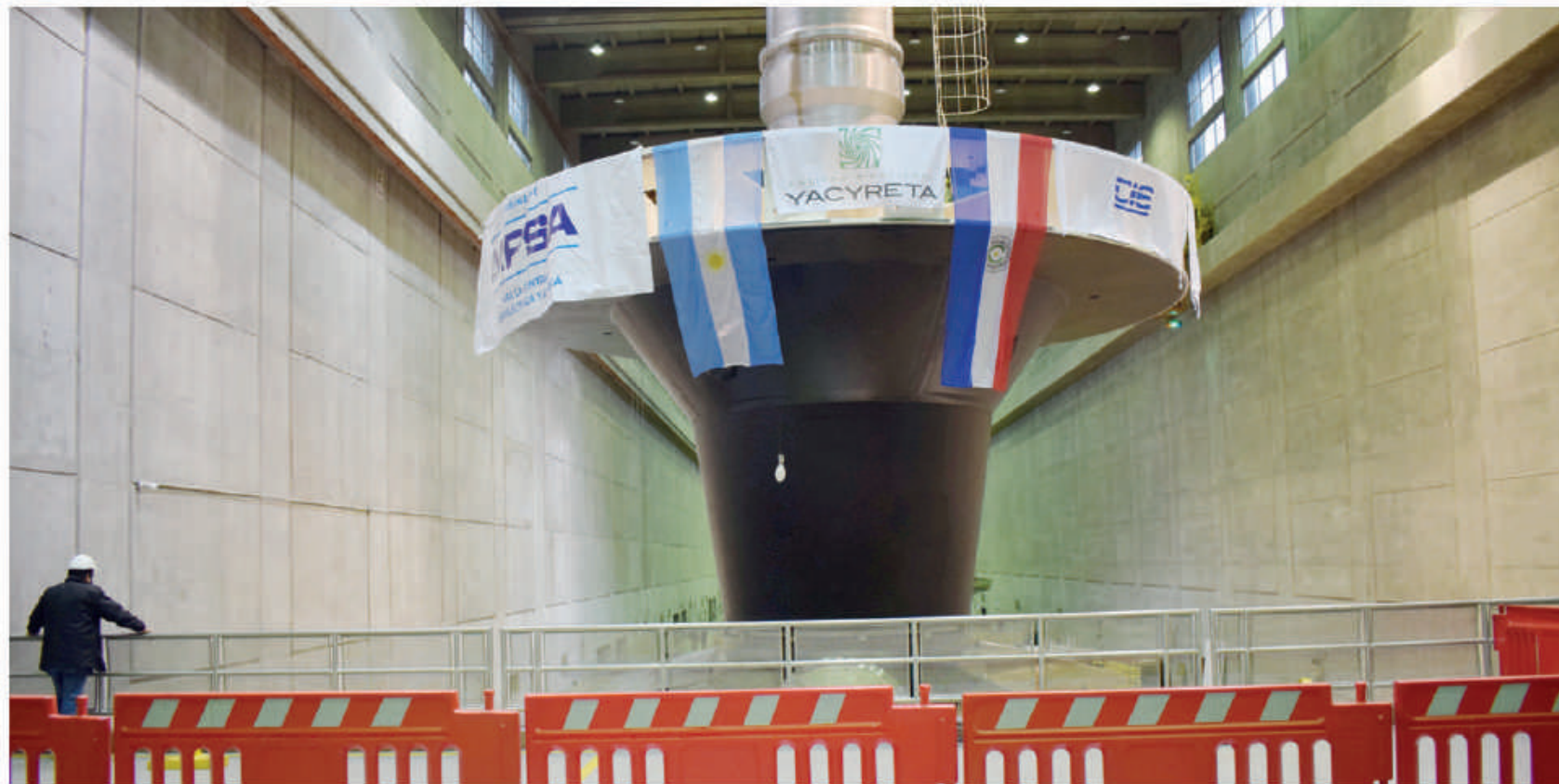
Turbina acondicionada a nuevo, en proceso de reinstalación.