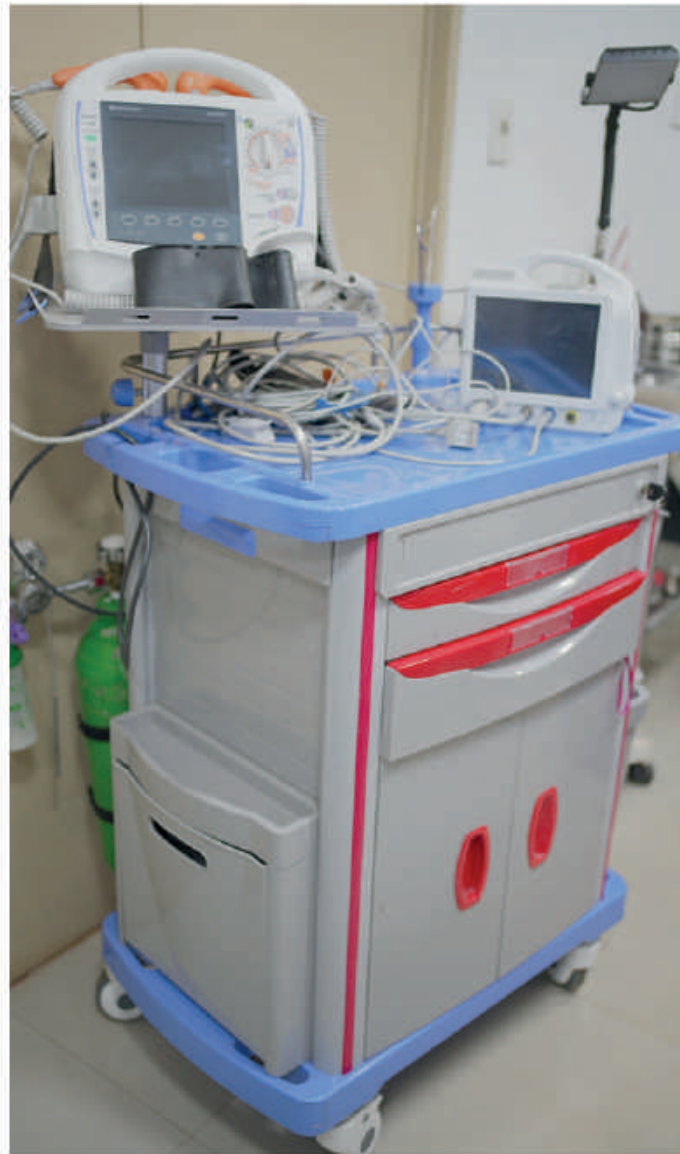
Equipo para Hospital de Santa Rosa.