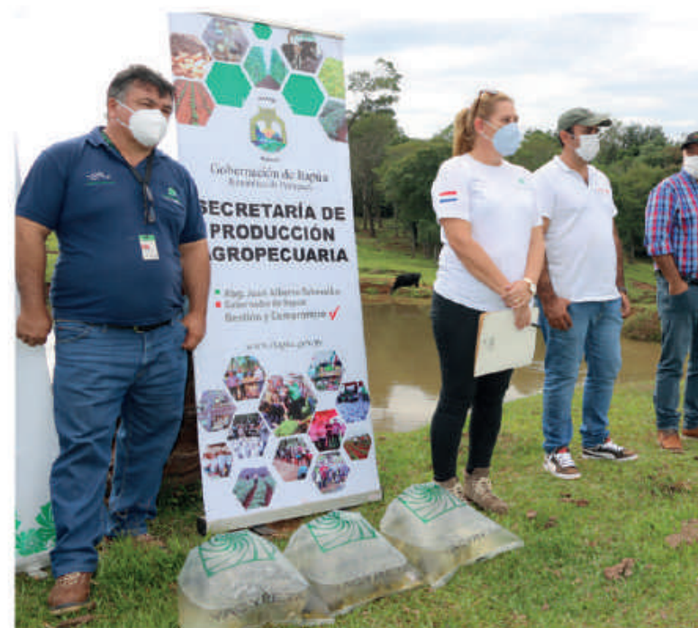
Entrega de alevines a piscicultores.

Además, con el mismo programa se ha sembrado en el río y entregado a piscicultores más de 5.800.000 alevines de especies nativas de un tamaño adecuado para su sobrevivencia, producidos en su estación de piscicultura desde el año 1999 hasta la fecha.