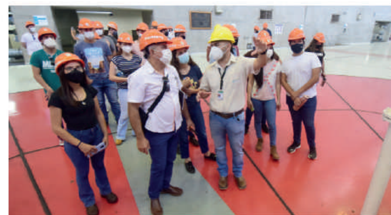
Visita guiada en casa de máquinas.

Las opciones incluyen la recepción, explicación de maquetas y proyección de video institucional en el centro de visitas de la Delegación de Relaciones Públicas.