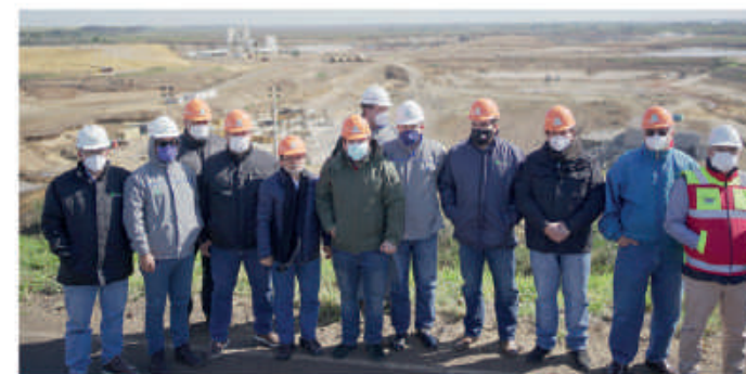
Miembros del Consejo de Administración, durante una visita a zona de obras de Aña Cuá.

Asimismo, participaron de reuniones de trabajo con el Ministerio de Relaciones Exteriores en las que se abordaron temas como alcances e implicancias de las Notas Reversales suscriptas entre los gobiernos de Paraguay y Argentina, relativas a la cogestión paritaria binacional y ordenamiento económico-financiero de la EBY.