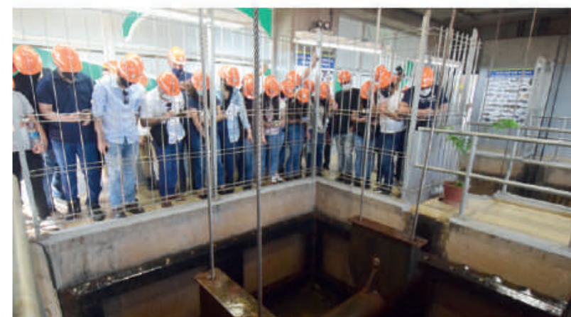
Escala de peces, uno de los atractivos de la Central Hidroeléctrica.