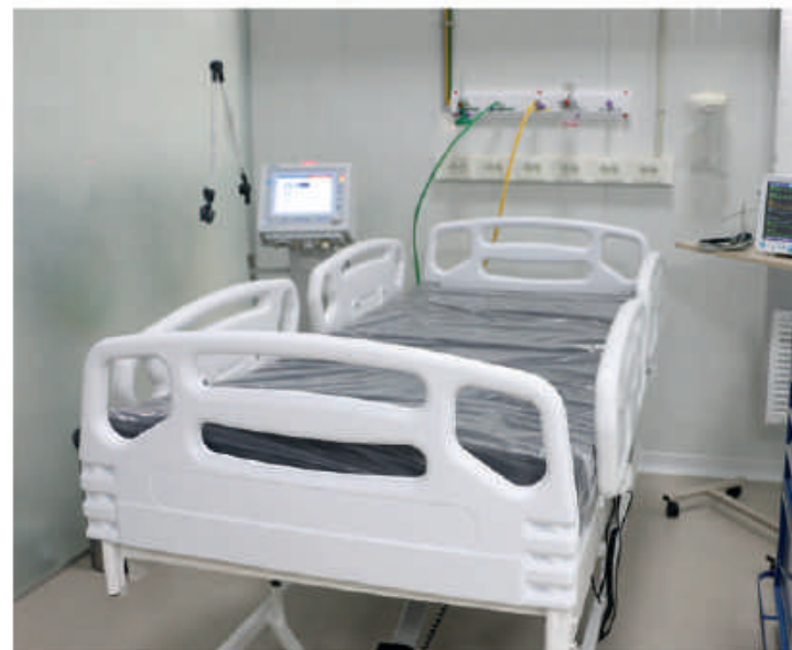
Camas de terapia intensiva en el pabellón de contingencia.

La edificación está asentada en el predio del Instituto de Previsión Social (IPS) local. La obra cuenta con una superficie construida de 1.700m 2 aproximadamente. Tiene, además, una planta generadora de oxígeno de 40m 3 /hora, sistema de gases medicinales, tanque de distribución de agua tipo copa para uso exclusivo del pabellón, sistema de prevención contra incendios, calles de acceso para ambulancia y servicios, parquización e integración funcional al pabellón existente, entre otros. En el lugar se instalaron 64 camas para internaciones, de las cuales 32 son para Terapia Intensiva. En una primera etapa, se invirtió la suma de G. 5.000 millones.