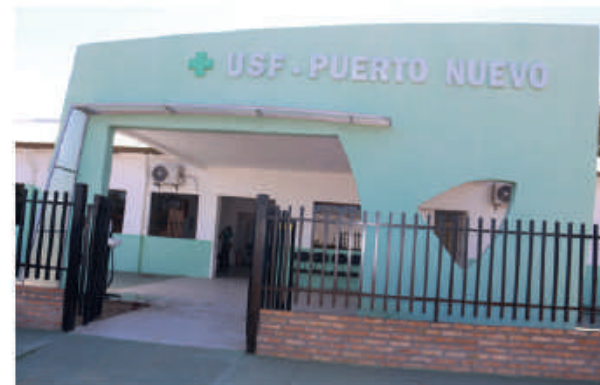
Nueva UFS de Colinas, Pilar.

Se ha concretado la provisión de un importante equipo de radiología para el Hospital distrital de Coronel Bogado (Itapúa), que facilita el acceso a estudios más avanzados a compatriotas que requieren este servicio. La entrega consistió en un Equipo Digitalizador CRX 10 con impresora de placa radiográfica, que fue instalado en una estación de trabajo, con monitor de grado médico, software, chasis para radiografía y calibración. El costo del equipo asciende a la suma de 299.500.000 guaraníes, con garantía de un año.