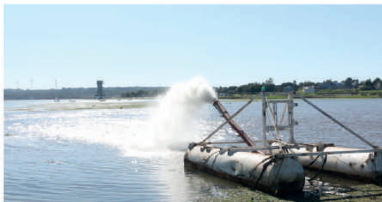
Limpieza de embalse.

Respondiendo al reclamo de pobladores, la Entidad Binacional Yacyretá lleva adelante la limpieza del cauce del arroyo "Las Hermanas", de Ñeembucú. Hasta fines de octubre los trabajos se realizaron en un tramo de aproximadamente 14 kilómetros de manera manual y mecanizada.