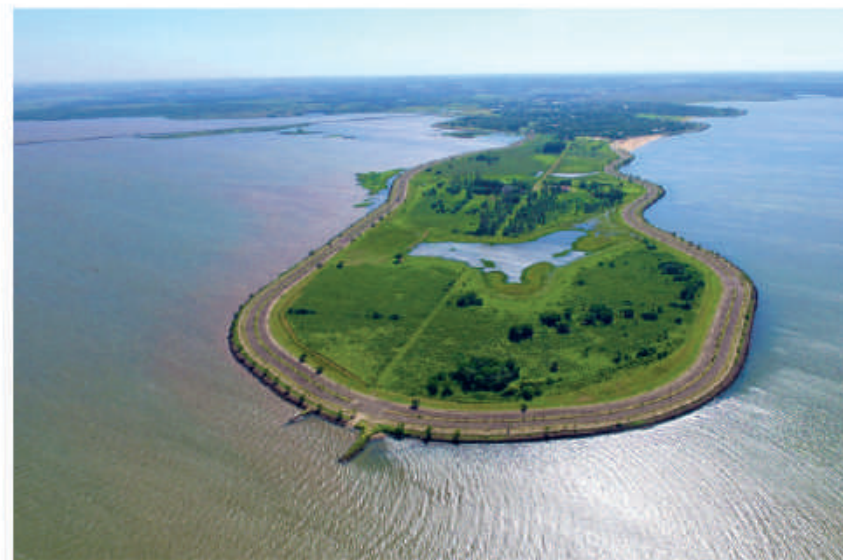
Las obras de infraestructura dan una nueva imagen a Carmen del Paraná.

El área del quincho de 147,75 m 2 cuenta con: galería, parrilla equipada, mesa de granito natural, mesada posterior de granito natural con bacha de acero inoxidable, antecocina y cocina, depósito, baños y vestuarios sexados. La inversión realizada fue de G. 782.469.947.