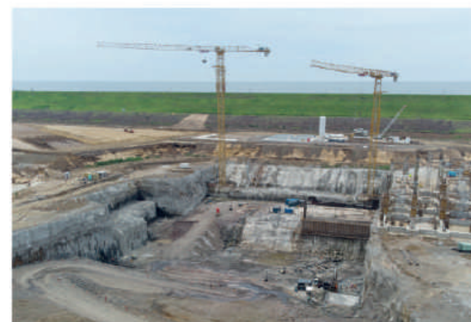
Obra de maquinización de Aña Cua, en plena ejecución.

En la zona de desplazamiento, fueron instaladas tres plantas hormigoneras y una fábrica de hielo, de vital importancia para la ejecución de los trabajos programados.