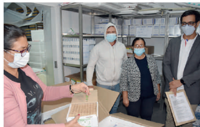
Medicamentos adquiridos para la lucha contra COVID-19.

El monto de inversión fue de G. 1.567.612.500. Los precios pagados fueron considerablemente más bajos que los ofertados en las farmacias de plaza. El grupo de medicamentos puestos a disposición de la cartera de Salud comprendieron: 500 unidades de Tigeciclina, 3.000 Piperacilina-Tazobactam, 3.000 Colistina, 10.000 Vancomicina; 2.000 Ciprofloxacina.