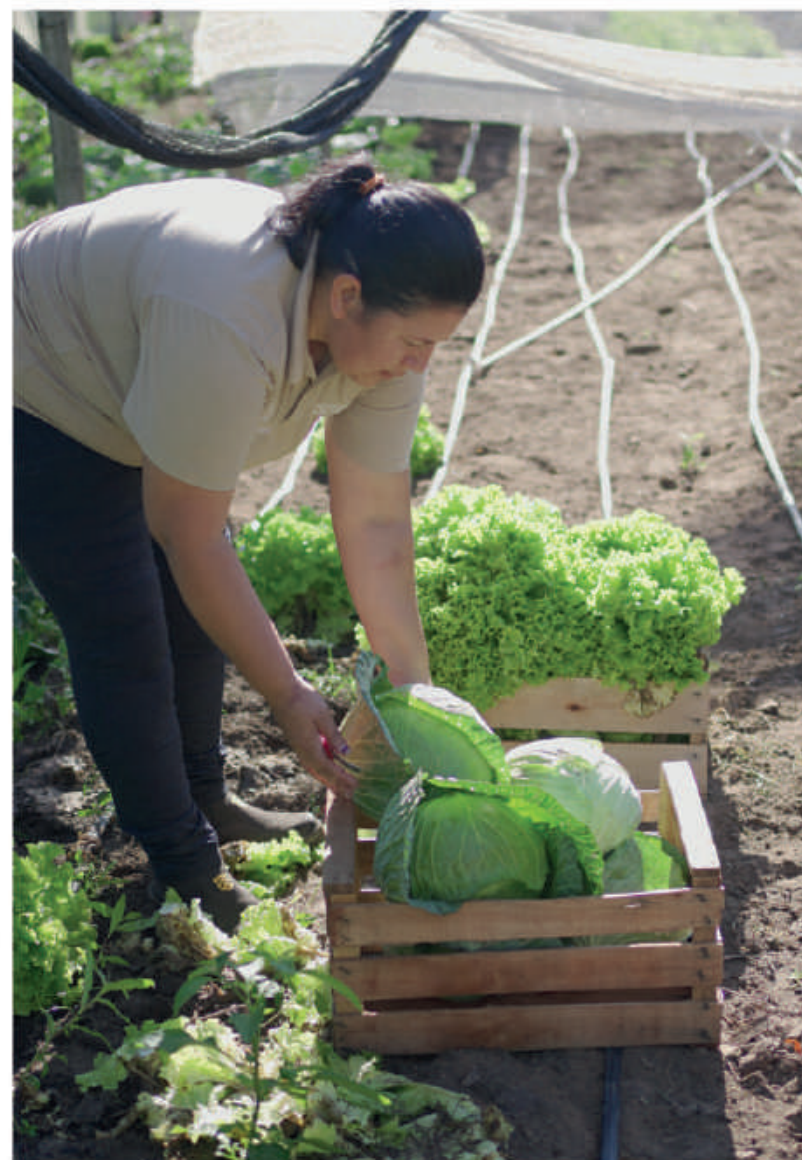
Horticultores de Ayolas producen verduras de excelente calidad.