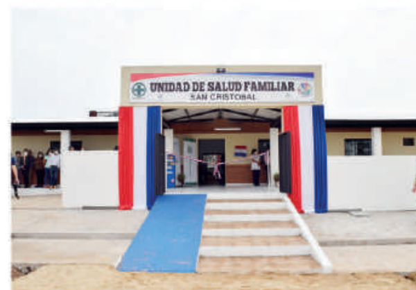
UFS de San Cristóbal, Misiones.