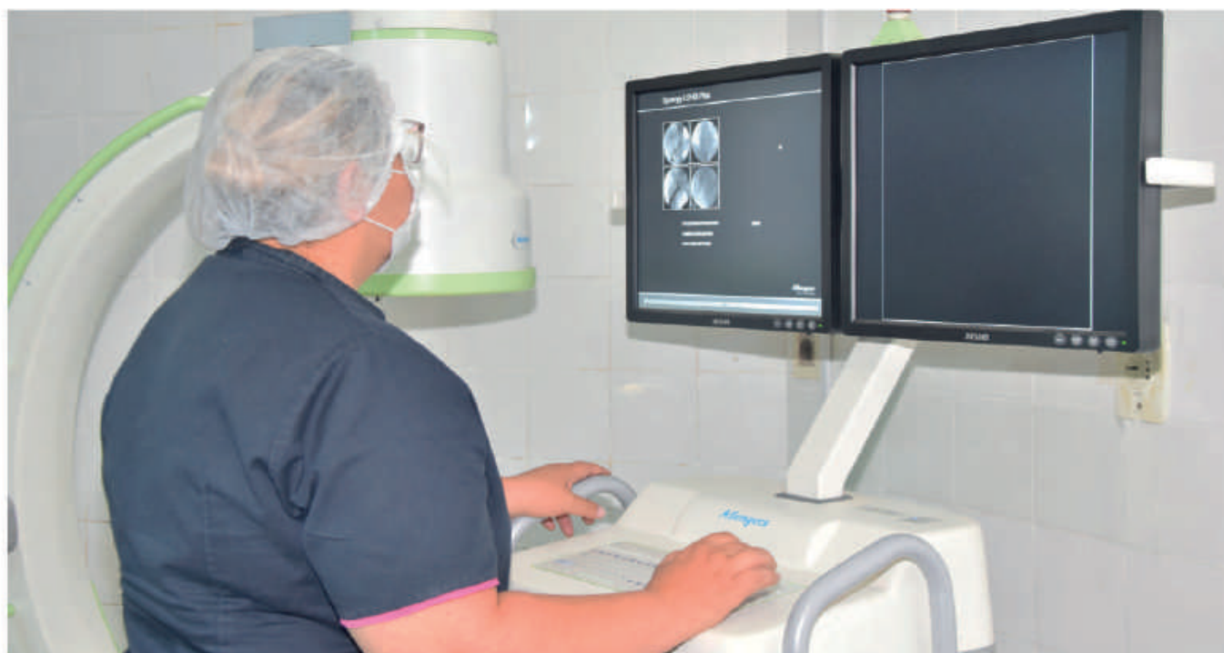
El sostenimiento del personal de salud en muchos hospitales del área de influencia fue posible mediante el apoyo de la EBY.