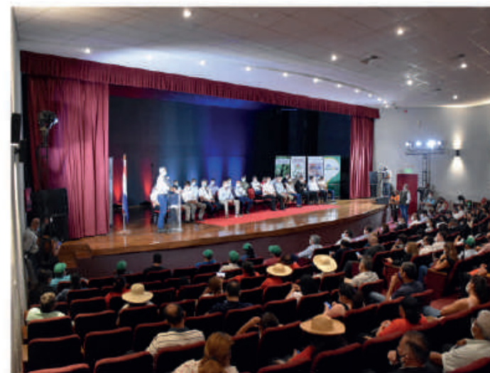
Teatro Municipal de Caacupé.

Las instalaciones cuentan con nuevo hall de acceso totalmente climatizado, cambio de fachada con revestimiento de porcelanato, sistema de iluminación e instalación eléctrica, instalación de sistema de detección y combate contra incendios, con tanque de 30.000 litros de capacidad. El Teatro puede albergar a 485 personas, con nuevo palco VIP en Planta Alta para 35 personas.