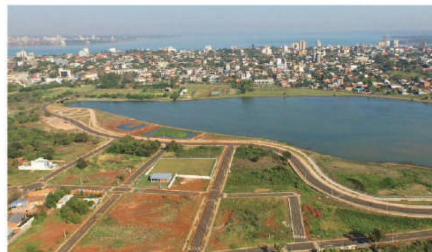
Cambyretá, un nuevo destino turístico, con costanera, anfiteatro y recomposición urbanística.

Los trabajos de recomposición urbanística y tratamiento costero como las obras de infraestructura que incluyen un mirador, un anfiteatro, baños públicos y la construcción de un salón multiuso van dando un nuevo aspecto a este distrito. Uno de los atractivos principales constituye el Mirador, que es un edificio de 8 niveles, 28,08 metros de altura aproximadamente, balcones con acceso por escaleras y un ascensor panorámico. Cuenta además con accesos principales y secundarios, oficina para administración, salón de eventos para 80 personas, bloque de baños sexados, salón de exposiciones, un depósito, entre otras comodidades.