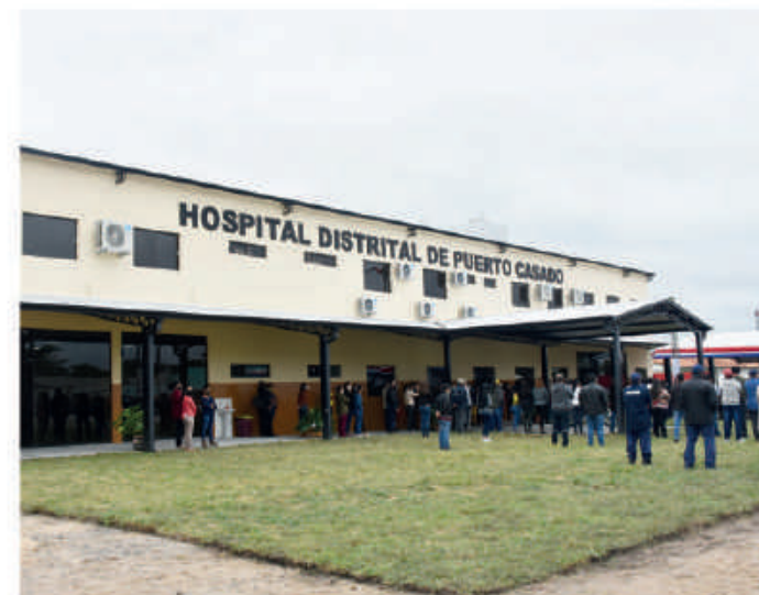
Hospital de Puerto Casado totalmente equipado por la EBY.

El Instituto Nacional de Cardiología "Prof. Dr. Juan A. Cattoni", Hospital San Jorge, se puso a la altura de los centros cardiológicos de América Latina mediante la habilitación del servicio de Tomografía, con equipamiento de alta complejidad, el de mayor resolución y definición de todo el sistema sanitario del país. El tomógrafo fue adquirido por el Gobierno, a través del Ministerio de Salud Pública con una inversión cercana al millón de dólares, y mediante la Entidad Binacional Yacyretá se construyó el búnker para su instalación. La infraestructura habilitada requirió una inversión de G. 1.541.726.486, más equipamientos, mobiliarios e instalación de gas medicinal por valor de G. 2.301.630.430. La obra consistió en la construcción del búnker destinado a sala de tomografía; sala de admisión, sala de elaboración de imágenes, y sala de información de estudios realizados. En el lugar, la EBY lleva invertido G. 9.254.519.969 bajo la actual administración.