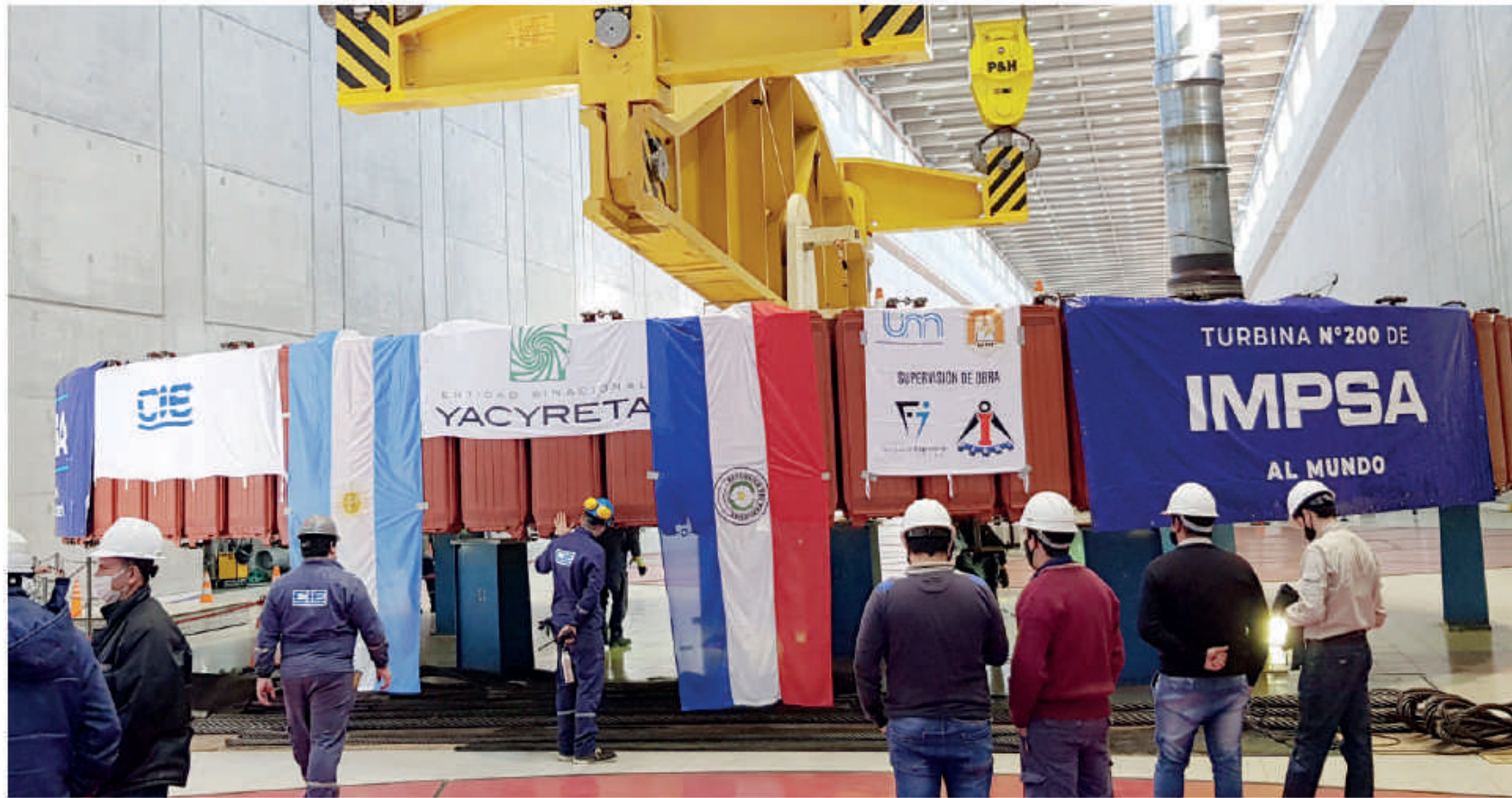
Trabajo de mantenimiento de turbinas.

El montaje del conjunto de eje, rodete y tapas que fue realizado en ambas unidades significó un trabajo sumamente complejo de varios sectores del Departamento Técnico y el consorcio CAPY (CIE-Paraguay/IMPSA-Argentina) contratado para el efecto.