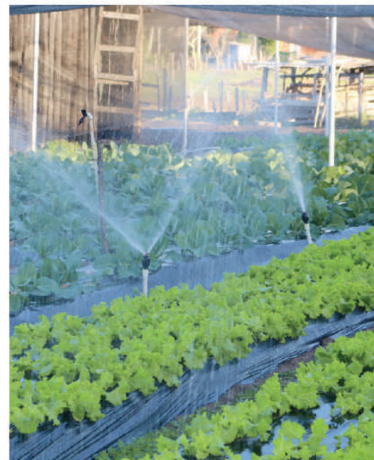
En Ñeembucú producen en invernadero con sistema de riego, mediante apoyo de la EBY.

Un total de 35.365 familias de Misiones, Itapúa y Caazapá son beneficiadas con proyectos de fortalecimiento de la producción agropecuaria, impulsados por el Gobierno Nacional a través de un convenio de cooperación entre la Entidad Binacional Yacyretá y cada una de las gobernaciones, siendo la inversión de G. 26.304.171.182.