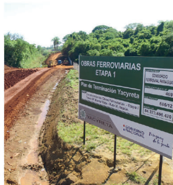
Inicio de obra en tramo ferroviario, en Encarnación.

La inversión que realiza la binacional en esta obra es de G. 84.373.696.420, equivalente a U$S 20.074.636 y tiene un plazo de ejecución de 360 días.