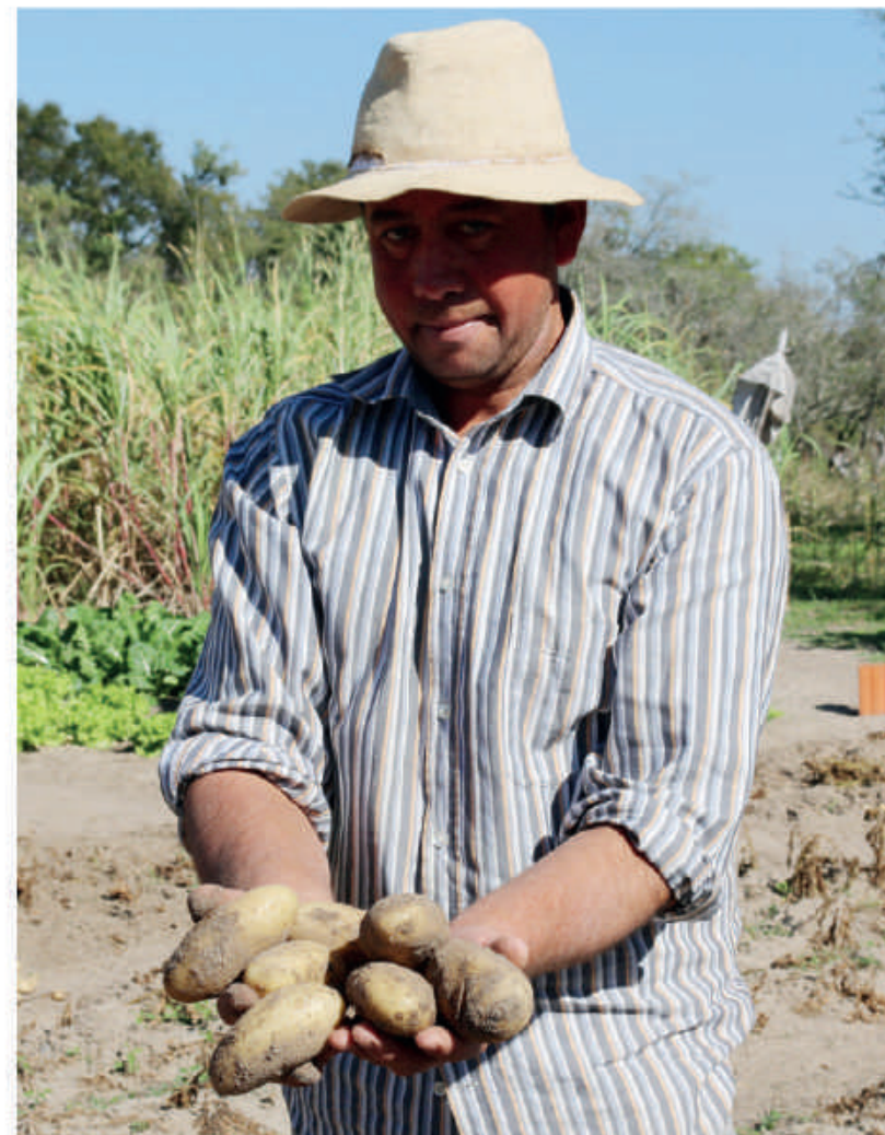
Papa de excelente calidad. La diversificación también es apoyada fuertemente desde la Binacional.

Fortalecimiento de la producción pecuaria y transferencia de paquetes tecnológicos. La inversión es de G. 4.950.295.000. Fortalecimiento institucional de los componentes Operativos y Administrativos requeridos para la ejecución de los proyectos provenientes de los convenios. El aporte es G. 3.452.632.032.