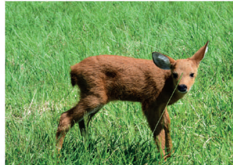
Cría de aguara guasú.

El nacimiento y la viabilidad de la cría de Aguara Guasú ( Chrysocyon brachyurus ) en cautiverio, es uno de los mayores logros del plantel de profesionales y colaboradores del Refugio Faunístico Atinguy. Esta especie, se encuentra en la lista roja (con problemas de conservación) de la Unión Internacional para la Conservación de la Naturaleza (UICN).