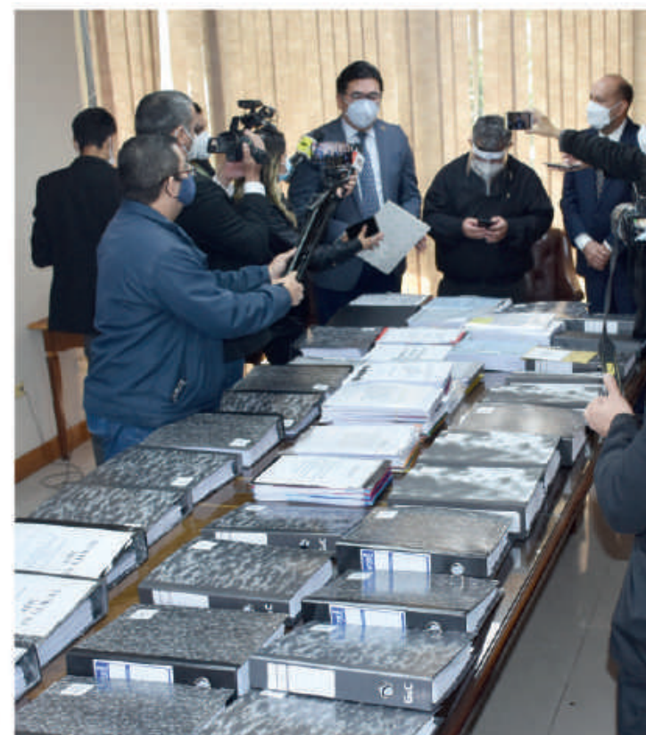
La EBY remitió al Congreso documentos respaldatorios de gastos sociales.