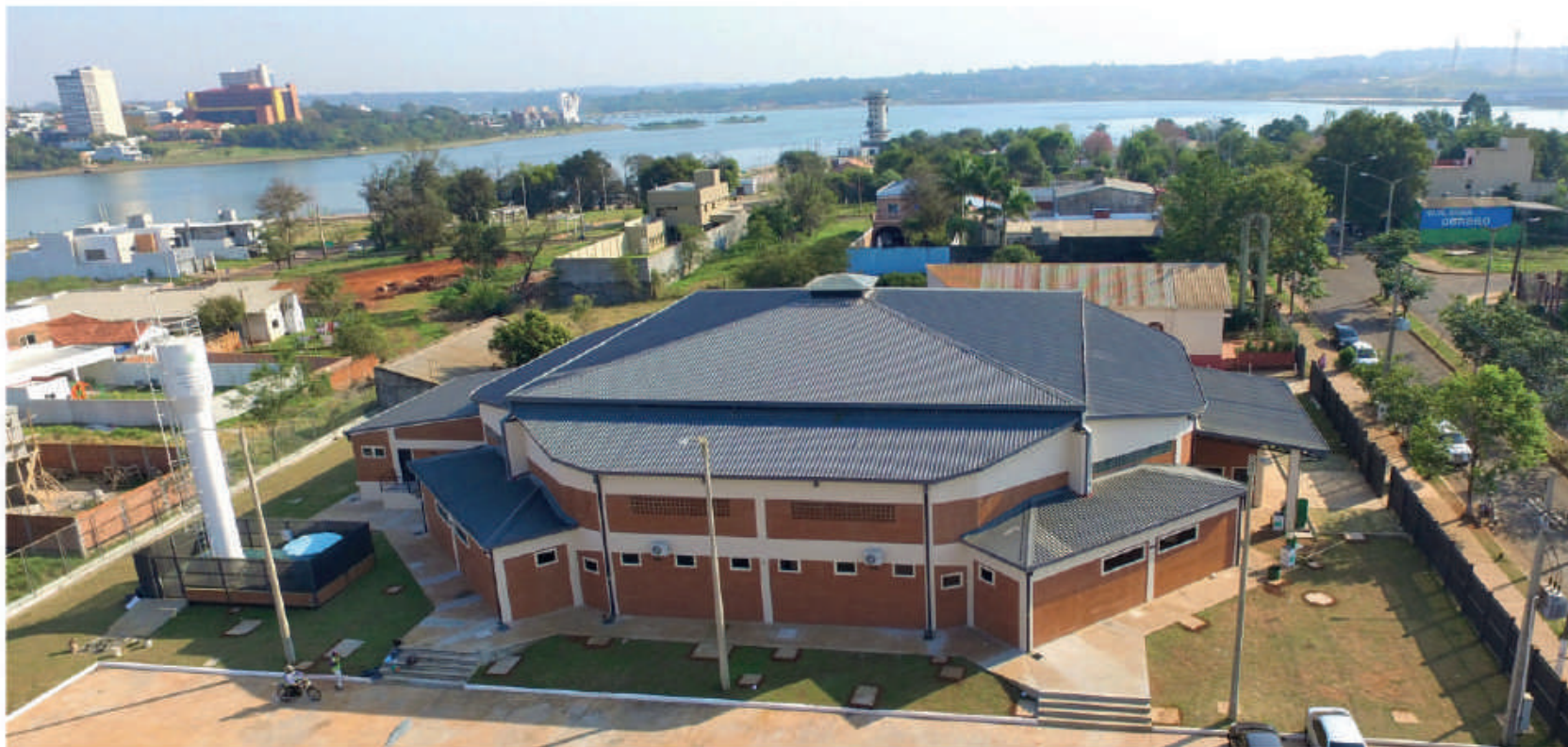
Salón multiuso construido en el barrio San Francisco, de Cambyretá.