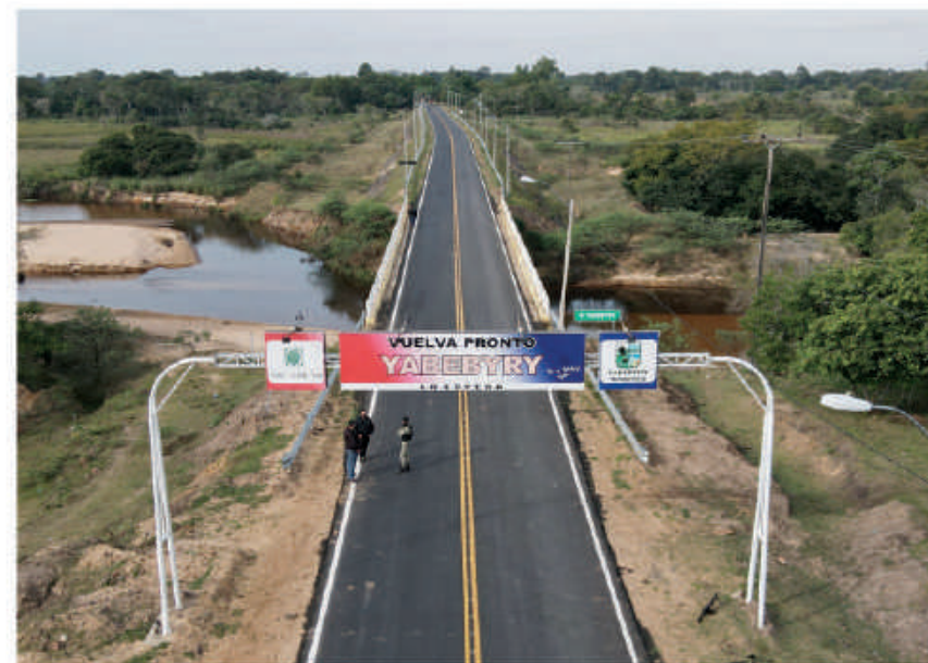
Nueva ruta de todo tiempo que une Corateí - Yabebyry.

En forma directa, el asfaltado del tramo vial beneficia a los pobladores de Yabebyry, así como los habitantes de compañías de Ayolas tales como Estero Bellaco, Misiones Poty, Kilómetro 15, Ñandú Potrero, e incluso a comunidades cercanas de Ñeembucú.