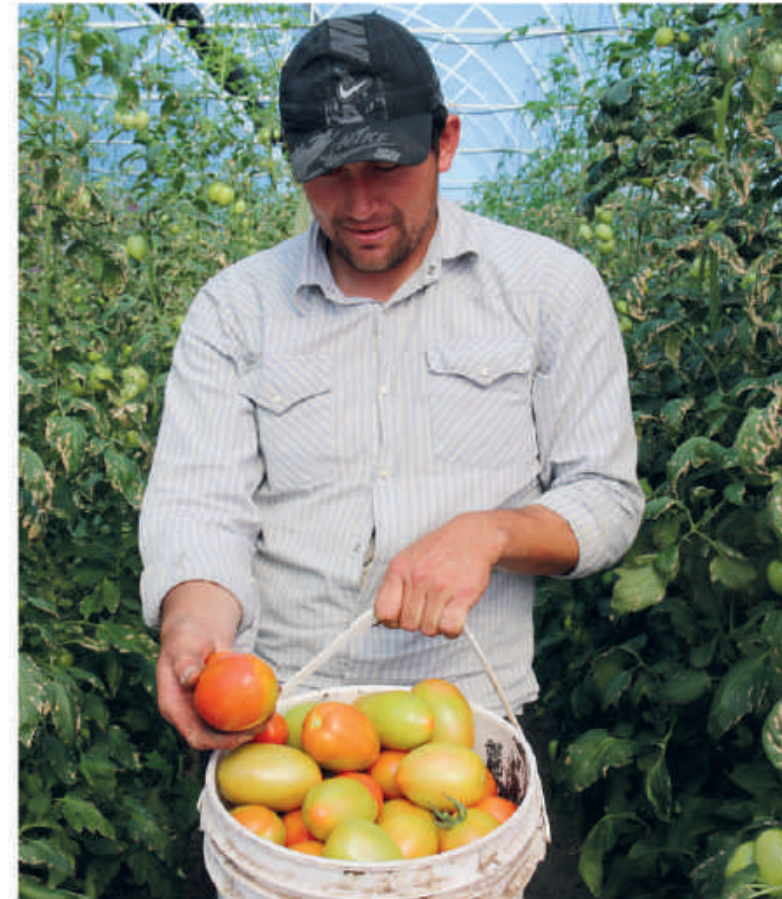
Óptima producción de tomate en invernaderos, tanto en Alto Paraná como en Misiones y Neembucú.