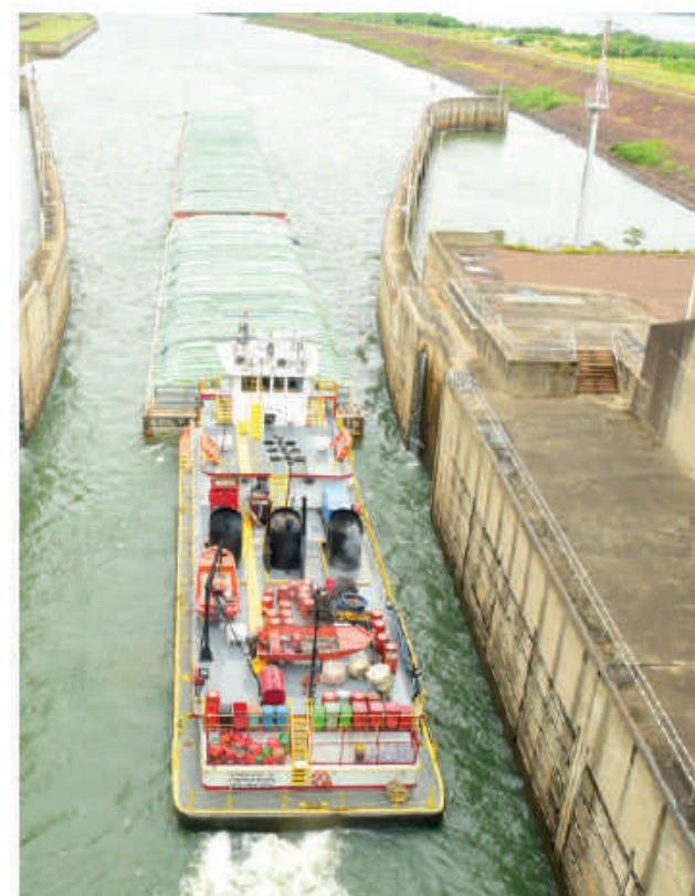
Esclusa de navegación.

En los últimos años, por la esclusa de navegación se registró un transporte promedio anual de 3.500.000 toneladas de granos, especialmente de soja, trigo, maíz, entre otros provenientes de altas zonas productivas como Itapúa, Alto Paraná y Misiones.