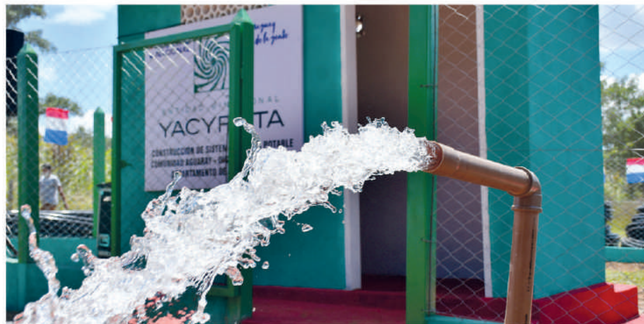
Miles de familias accedieron al servicio de agua potable mediante inversión de la EBY.

El agua potable es esencial para la salud. El apoyo para la construcción de sistemas de provisión, extensión de servicios para llegar cada día a más hogares, también forma parte de los proyectos de inversión social de la Entidad.